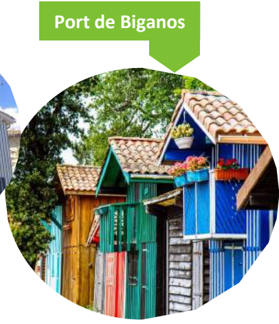
Port de Biganos